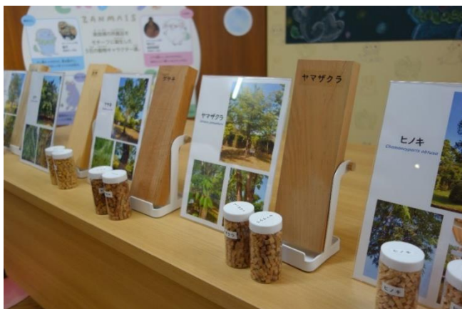
仏像製作に用いられる木材の サンプル