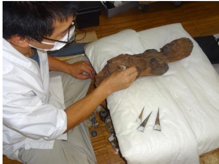
蔵王権現立像（当館）虫蝕処置