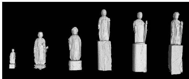
▲体部に納められた地藏菩薩と見られる小さな仏像（6体）

常念寺に伝来した釈迦三尊像のうちの中尊。施無畏印・与願印を結び結跏趺坐する本像を中心に、それぞれ獅子・象に乗る文殊菩薩と普賢菩薩が脇侍をなす。3軀は目尻が切れ上がる両眼や鼻梁の太い鼻、厚い唇をもつやや面長の顔立ち、分厚い体軀が相通じ、一具同時の作とみられる。とりわけ目を引くのは、中尊の体部に密着する着衣と蛇行する衣文線、および両膝頭側面の回転文であろう。前者は中国・宋代の仏画に同種の表現が認められ、これを写したものと捉えられるが、中国ではインド風を伝える要素と捉えられたことが指摘されており、本像では生ある釈迦の姿に近づこうとする意図をもって採用された可能性も想定される。