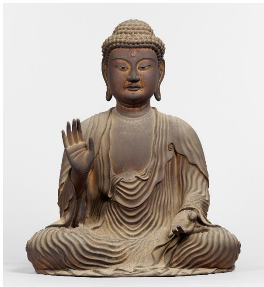
▲釈迦如来坐像（京都・常念寺蔵）

釈迦如来像および両脇侍像とX線CTスキャンの写真は、特別展「聖地 南山城」にて公開しております。この機会にぜひご覧ください。