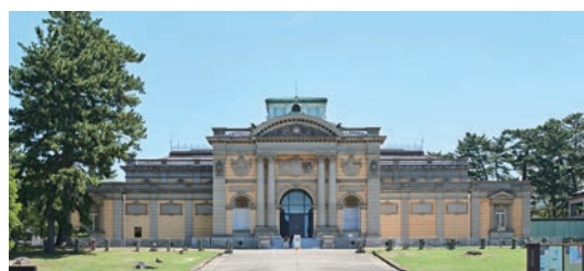
なら仏像館 西側正面